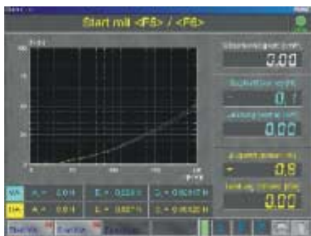
Integriertes Speicheroszilloskop (Standard)