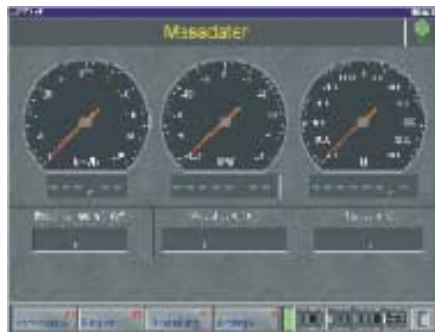
Prüf- und Diagnosemodi